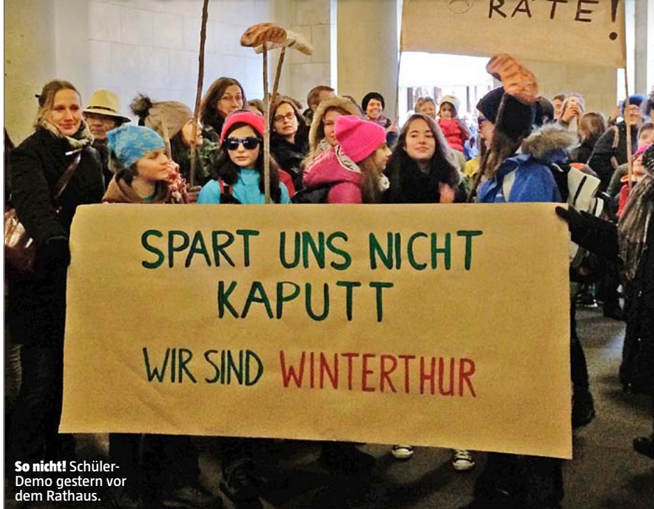
So nicht! Schüler-Demo gestern vor dem Rathaus.

BUDGET → Das Winterthurer «Sparlament» schnallt den Gürtel enger. Nur gegenüber den Schülern zeigten die Politiker ein wenig Herz.